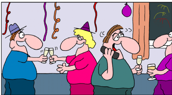
Prost Neujahr Herr Nachbar, stellen Sie bitte Ihren Fernseher leiser, Sie stören unsere Party!